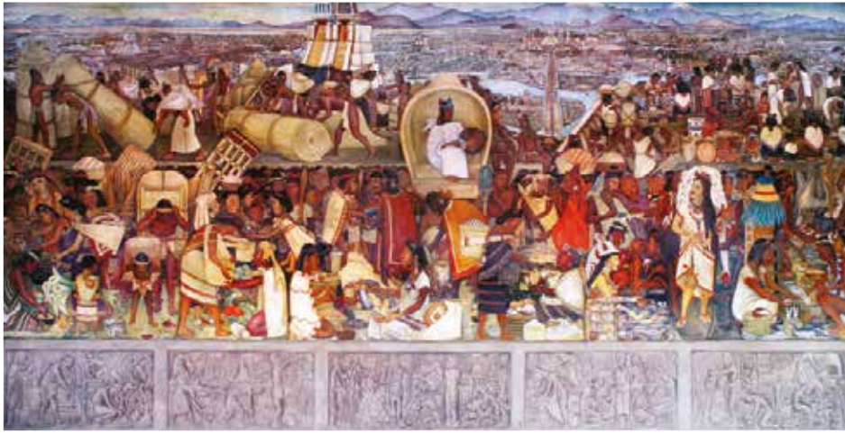
► “El mercado de Tlatelolco” Fotografía del Mural de Diego Rivera en el que se representa el mercado de Tlatelolco.