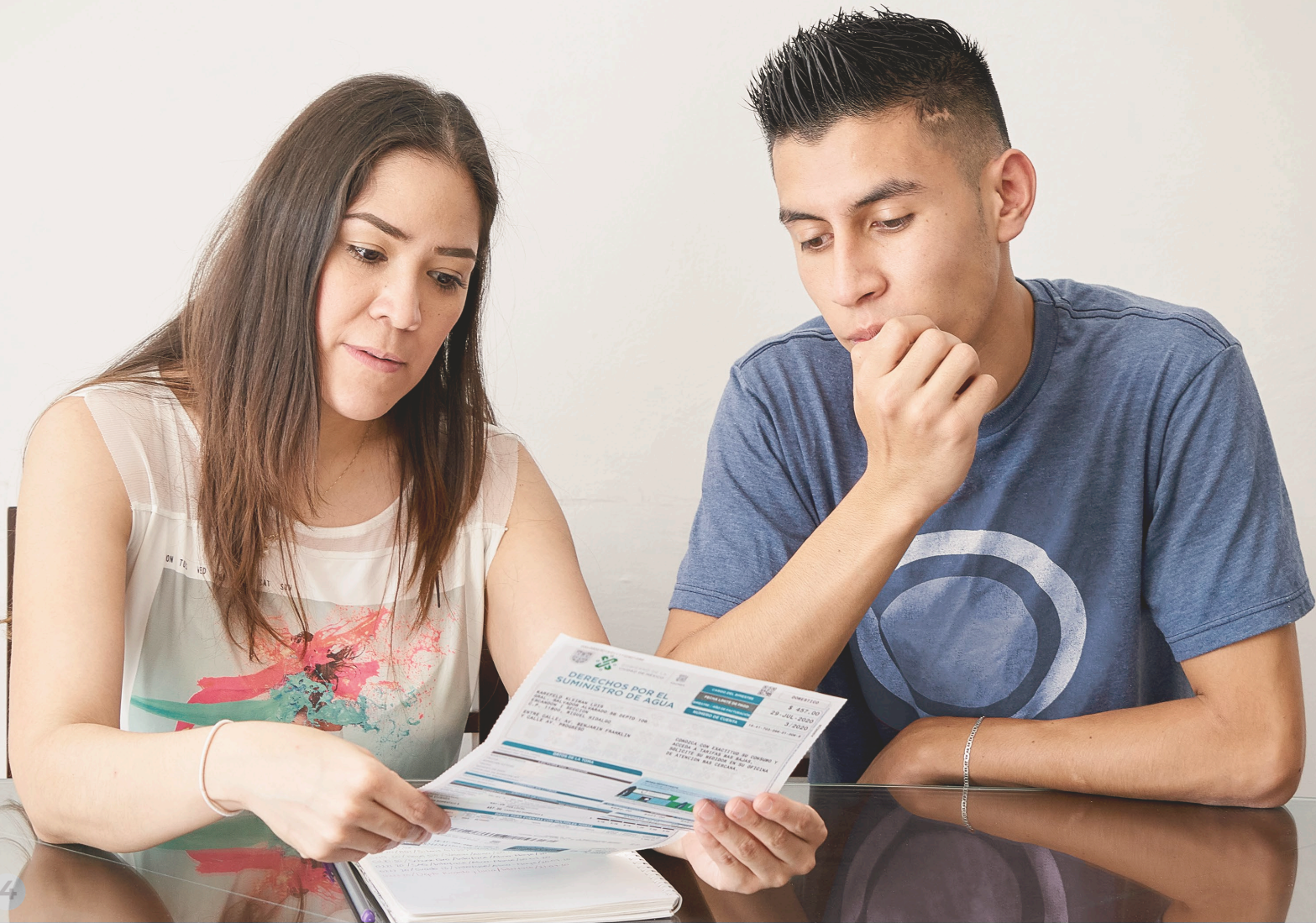
FICHA EDUCATIVA DEL PAQUETE DIDÁCTICO 5.22

El historial crediticio de una persona, refleja el comportamiento cuando ha recibido algún tipo de crédito. Si por alguna razón pides un crédito o un préstamo, y no pagas a tiempo o dejas de pagar tus deudas, esto se verá reflejado en tu historial, es decir, irás adquiriendo una mala reputación y esto te perjudicará, sobre todo si deseas solicitar otro financiamiento.